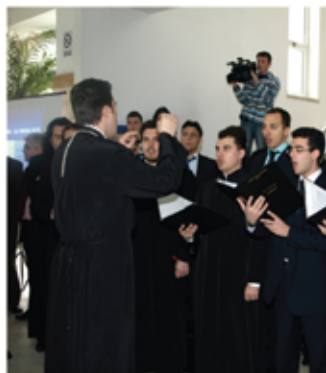
Studenți la Facultatea de Teologie

Specializarea Artă Sacră (Muzică) a fost înființată în anul 2005, prin reorganizarea fostei specializări Teologie - Pedagogie Muzicală, înființată în anul 2001. Absolvenții acestei specializări vor putea acoperi golurile existente în această privință ca profesori de muzică la seminariile teologice, facultățile de teologie și școlile de cântăreți bisericești, profesori de Religie și de Educație Muzicală la școlile cu clasele I-VIII, psalți și protopsalți în mănăstiri, catedrale și biserici, dirijori de coruri bisericești. Programul își asumă formarea de specialiști în domeniul muzicii bisericești. Se are în vedere asigurarea mobilității profesionale în domeniu prin stimularea creativității și a abilității de cercetare, precum și prin studierea unor capitole fundamentale din aria muzicală laică. Este singura specializare cu acest caracter din sistemul de învățământ românesc teologic actual.